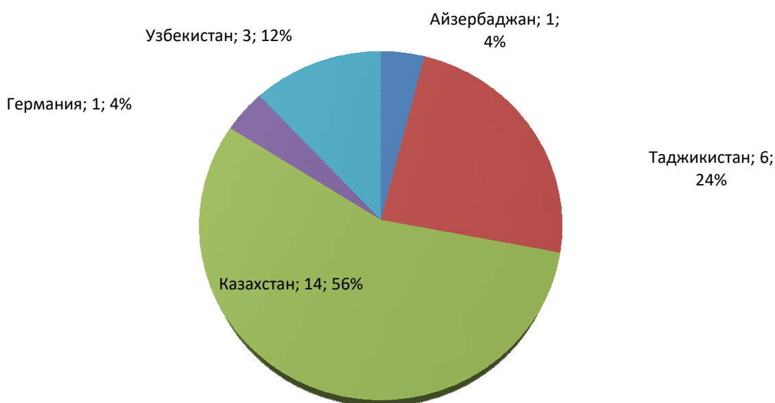
Рис.1. Структура иностранных студентов, обучающихся по программам высшего образования в УрСЭИ на 31.12.2022 г.

В УрСЭИ (филиале) ОУП ВО «АТиСО» проходят обучение по программам высшего образования граждане Российской Федерации, Армении, Казахстана, и Узбекистана. По состоянию на 31.12.2022 г. контингент иностранных студентов составил 25 человек.